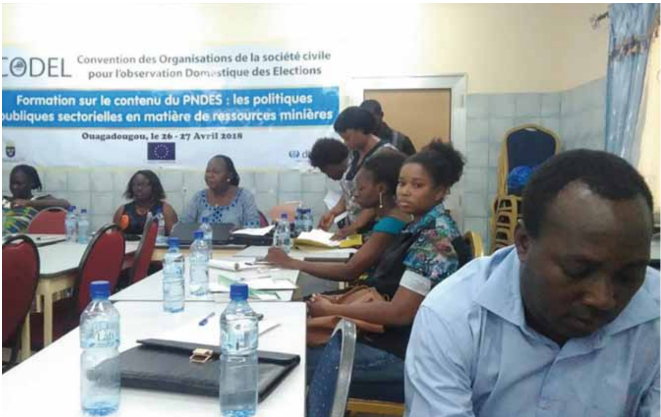
Les participants à l'atelier de formation

La Convention des Organisations de la société civile pour l'observation Domestique des Élections Locales (CODEL) a animé deux ateliers de formation sur le contenu du Plan national de développement économique et social (PNDES), avec la participation de représentants du Centre d'information et de documentation citoyennes (Cidoc).