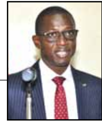
Par K. Augustin Somé Coordonnateur du Cidoc