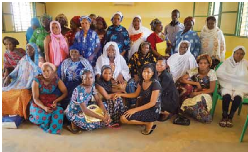
Photo de famille à la fin de la formation

Mieux, ces femmes ont animé une émission radiophonique à la fin de la formation. Ce qui entre en droite ligne de leur engagement pour la sensibilisation des populations sur la participation citoyenne à la gouvernance sécuritaire. A l'occasion, des réponses (en français, fulfuldé, tamachèque et songhai) ont été données par les participantes aux questions posées sur les enjeux et défis sécuritaires dans la région du Sahel, le rôle des femmes dans la