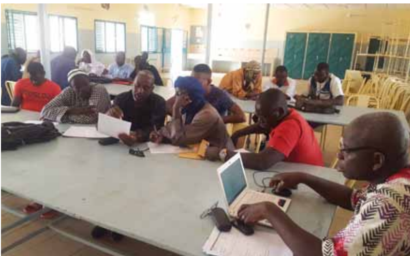
... participants en séance d'atelier