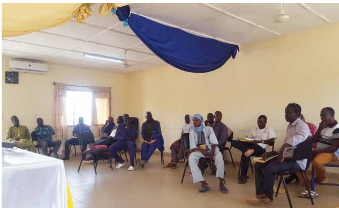
Formation des élus locaux à Dori...

Dans son élan de renforcement des capacités des élus locaux, le Centre d'information et de documentation citoyennes (Cidoc), a assuré une série de sessions de formations au profit de conseillers municipaux des régions des Cascades, du Sud-ouest, du Centre et du Sahel. Ces formations ont été animées autour des thématiques ci-après : «Cadre normatif de la gouvernance locale», «Principes directeurs de la gouvernance locale», «Les responsabilités des acteurs de la gouvernance locale», «La place de la communication dans l'accomplissement des missions de l'exécutif local», «Les outils de la communication institutionnelle», «L'organisation de la communication de l'exécutif local», «La communication individuelle de l'élu local», «La communication non-violente», «Au-delà de la communication, la proximité», «Comment asseoir et entretenir la confiance auprès des populations?».