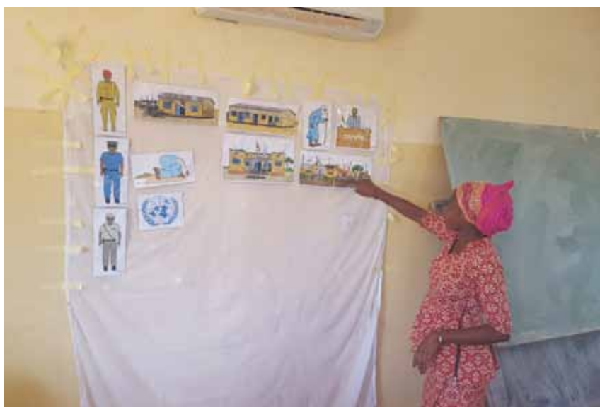
Une participante utilisant la "Boîte à images" et l'expliquant aux autres participantes

La réponse à cette réside dans un module qui leur a été dispensé. Il