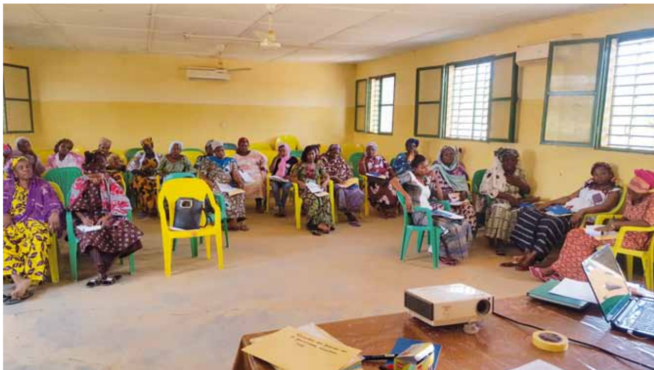
Formation des femmes à Gorom-Gorom, participantes suivant une communication

Du 11 au 13 juin 2018, une délégation du Centre d'information et de documentation citoyennes (Cidoc) a séjourné à Gorom-Gorom où elle a animé une formation au profit de femmes venues de plusieurs communes de la région du Sahel. Cette formation a porté sur la participation citoyenne, spécifiquement la participation des femmes, à la gouvernance sécuritaire.